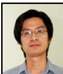
รศ.ดร.วิโรจน์ อรุณมานะกุล ภาษาศาสตร์