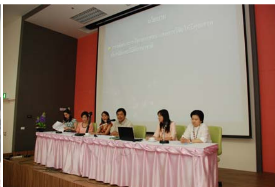
สัมมนาอาจารย์คณะอักษรศาสตร์ ประจำปี 2555 วันที่ 19 เม.ย. 55