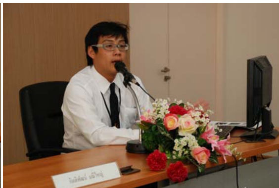
ประชุมวิชาการด้านมนุษยศาสตร์ระดับปริญญาตรี จุฬา-ธรรมศาสตร์-เกษตรฯ ครั้งที่ 1 (Undergraduate Humanities Symposium) 10-11 มี.ค. 55