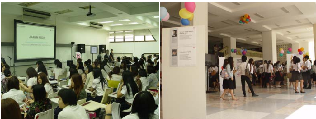
บรรยายพิเศษและประชุมเชิงปฏิบัติการ เรื่อง "Cool Japan" 7 ก.พ. 55