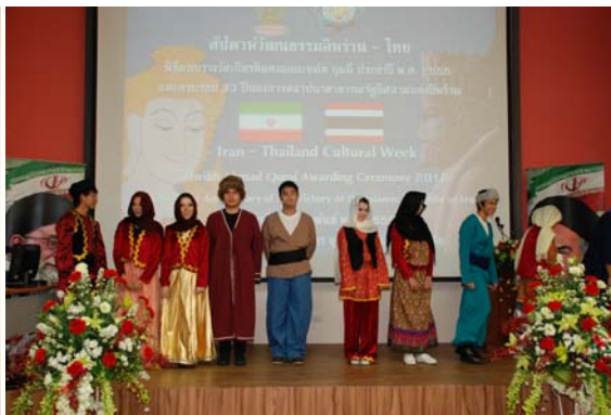
สัปดาห์วัฒนธรรมอิหร่าน-ไทย 7-10 ก.พ.55