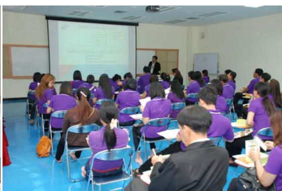
สัมมนาเจ้าหน้าที่คณะอักษรศาสตร์ประจำปี 2555 วันที่ 24-25 พ.ค. 55