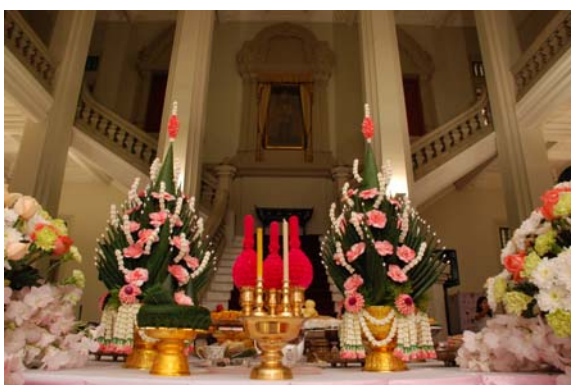
สักการะพระบาทสมเด็จพระจุลจอมเกล้าเจ้าอยู่หัว 20 ก.ย. 55