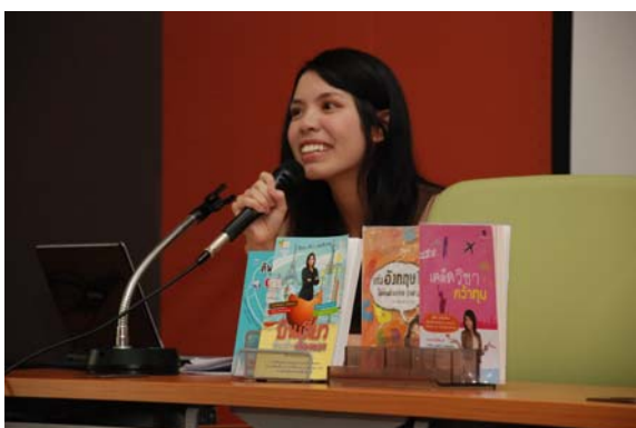
GAT Tutoring for Flood Victims (ร่วมกับศิษย์เก่าในการจัดโครงการ) 14 ต.ค. 54