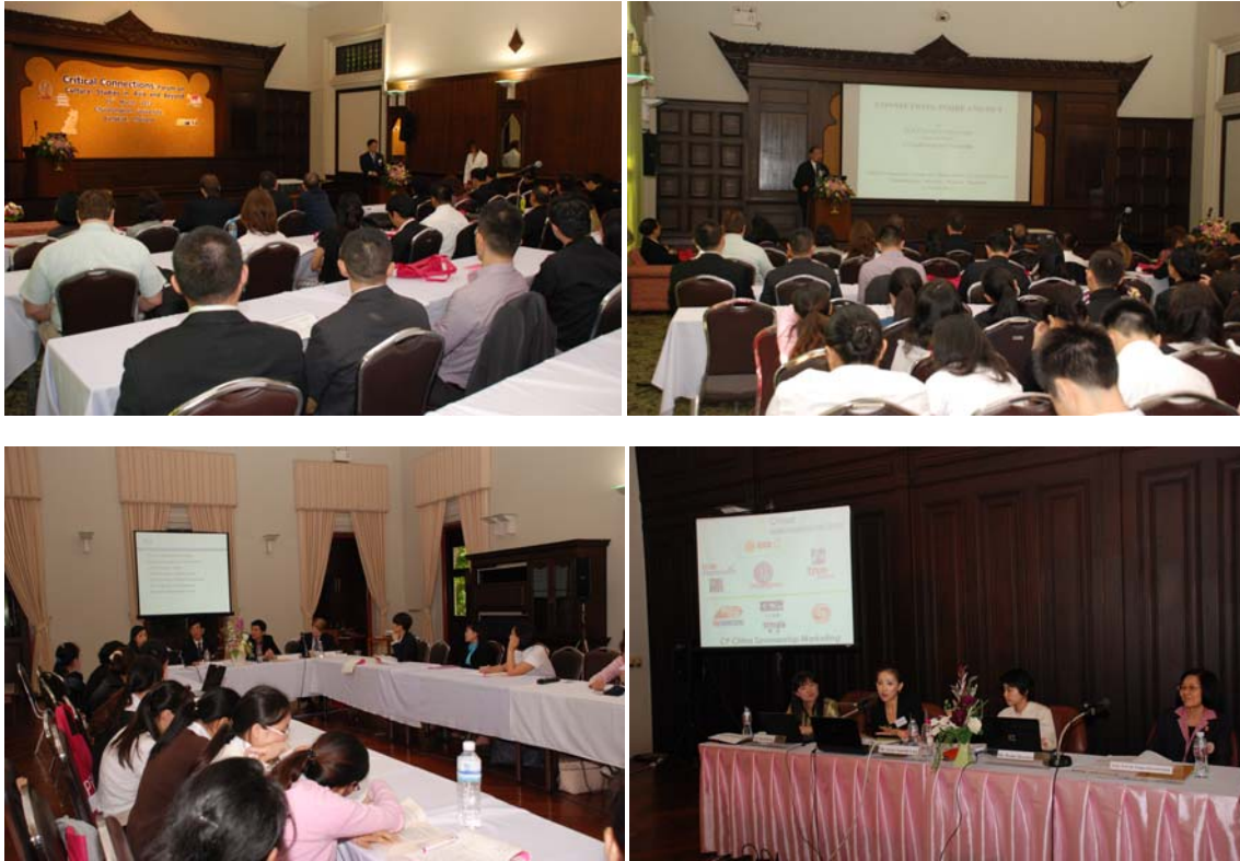
ประชุมนานาชาติ “Critical Connections: Forum on Cultural Studies in Transnational Asia and Beyond” 16 มี.ค.55