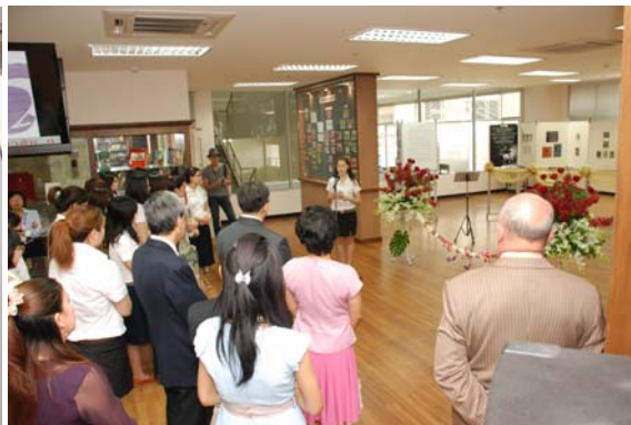
"Two Cultural Weeks of Art and Poetry" เพื่อเฉลิมฉลองครบรอบ 40 ปี แห่งความสัมพันธ์ทางการทูตระหว่างราชอาณาจักรไทยกับสาธารณรัฐ โปแลนด์ 6-20 ก.ค. 55