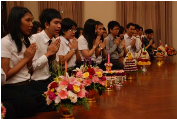
ไหว้ครูประจำปี 2555 ภาควิชาภาษาไทย 21 มิ.ย. 55