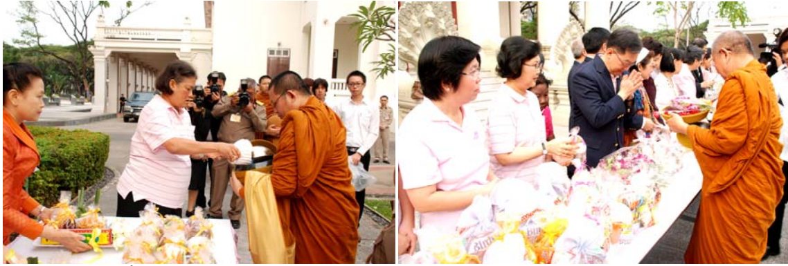
ทำบุญ-ตักบาตร เนื่องในวันคล้ายวันสถาปนาคณะอักษรศาสตร์ 4 ม.ค. 55