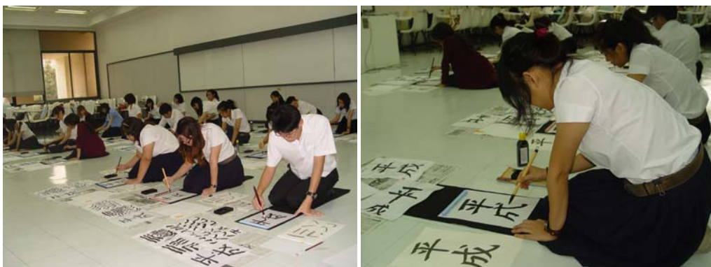
โครงการฝึกเขียนพู่กันญี่ปุ่น 13, 17 ก.พ. 55