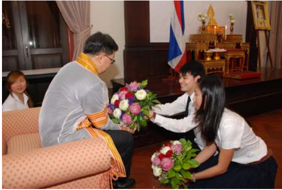
ไหว้ครูคณะฯ 14 มิ.ย. 55