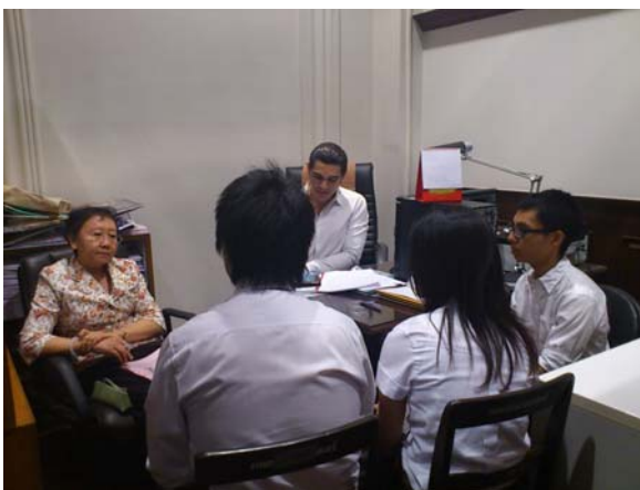
บรรยากาศการตรวจประเมินคุณภาพ วันที่ 17 ส.ค. 55