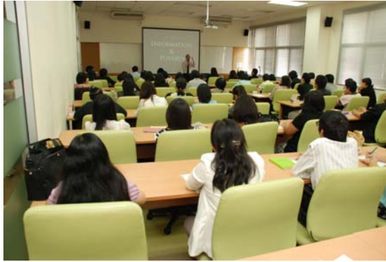
สัมมนาวิชาการ "การวิจัยสารสนเทศร่วมสมัย: มุมมองไทยและเทศ" 29 ส.ค. 55