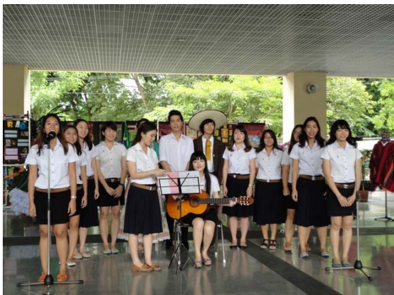
นิทรรศการ “ผู้โลกาตินอเมริกา” 6 – 10 ส.ค. 55