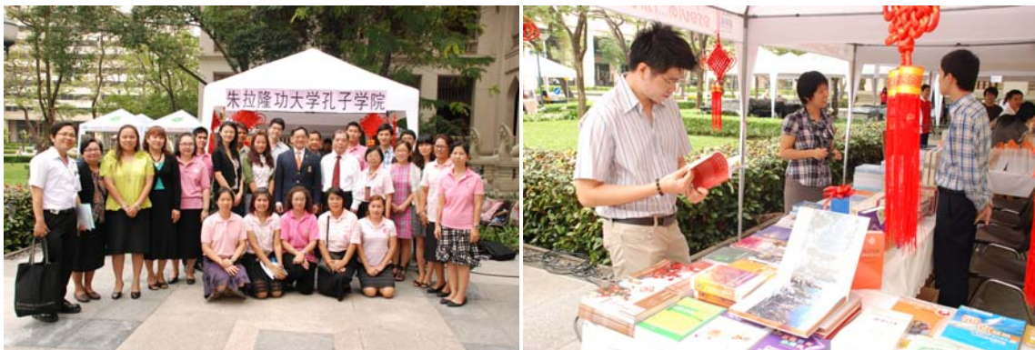
เทศกาลงานออกร้านหนังสือในสวน ศูนย์สารนิเทศ 11-13 ม.ค. 55