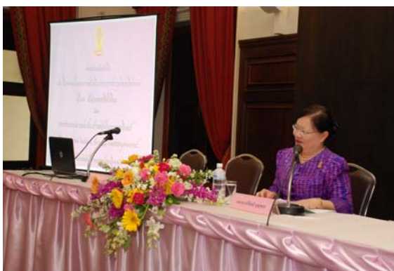
เสวนาน้อมรำลึก 50 ปี การเสด็จพระดำเนินร่วมการประชุมทางวิชาการ เรื่อง “ปัญหาการใช้คำภาษาไทย” และหัวข้อเรื่อง “ภาษาไทยในบริบท ASEAN” 27 ก.ค. 55